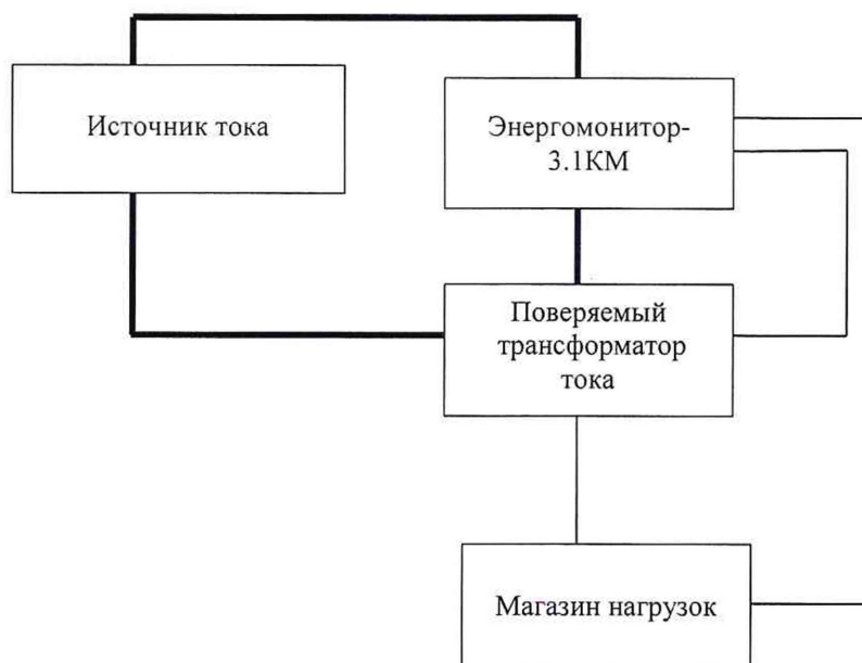
Рисунок 2 – Структурная схема определения погрешностей трансформаторов при значении номинального тока 0,2 % с использованием Энергомонитора 3.1KM

9.5.1.3 Для определения погрешностей при значении 0,2 % от номинального тока собрать схему, указанную на рисунке 2.