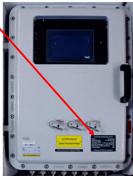
Рисунок 2 – Контроллер во взрывозащищенном шкафу