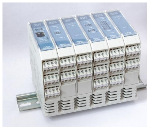
Рисунок 4 – Функциональные модули контроллера