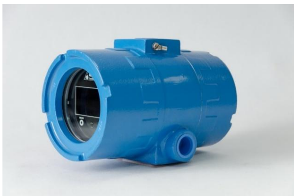
Рисунок 3 – Контроллер во взрывозащищенной оболочке