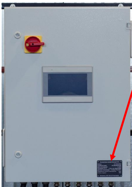
Рисунок 1 – Контроллер в шкафу общепромышленного исполнения

Маркировочная табличка, место нанесения знака утверждения типа