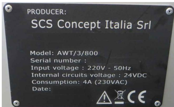
Рисунок 1 - Пример заводской таблички стендов

Общий вид стендов приведён на рисунке 3.