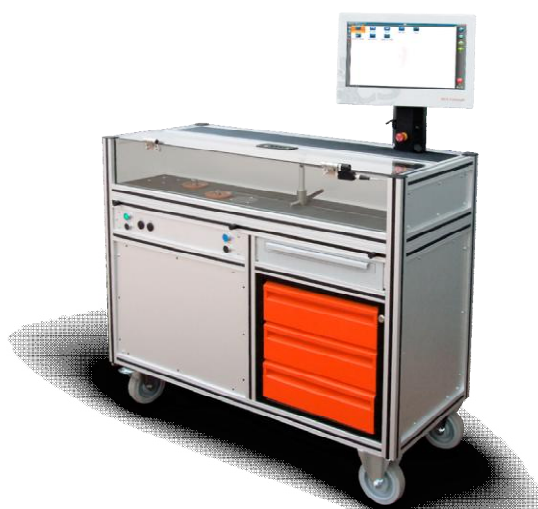
Рисунок 3 - Общий вид стендов для измерений крутящего момента силы серии AWT