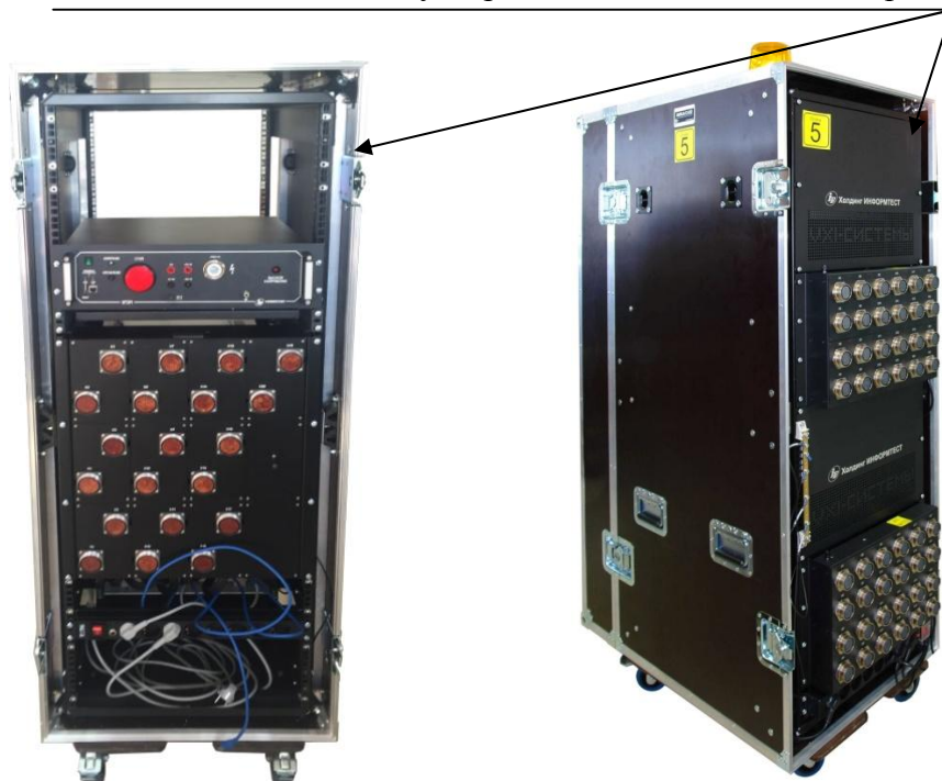
Рисунок 2 – Внешний вид систем на основе стандарта LXI, включающих до 4600 каналов (слева) и более 4600 каналов (справа)

Места нанесения знака утверждения типа и знака поверки