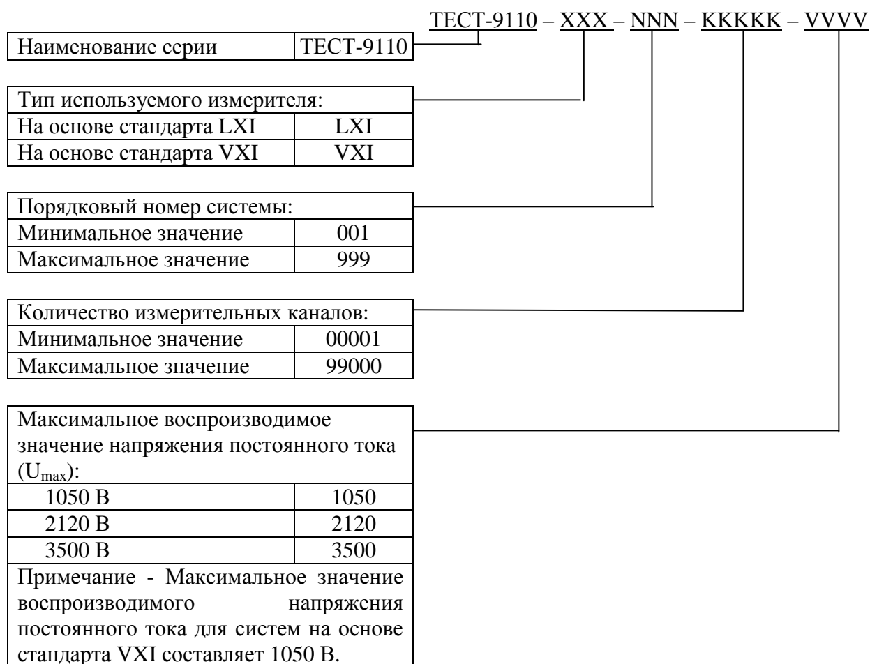
Рисунок 1 – Обозначение модификаций систем

Внешний вид систем на основе стандарта LXI приведен на рисунке 2, внешний вид систем на основе стандарта VXI приведен на рисунке 3. Места нанесения знака утверждения типа и знака поверки предусмотрены на боковой панели стоек электронных систем, включающих до 4600 каналов, и на передней панели стоек электронных систем, включающих более 4600 каналов.