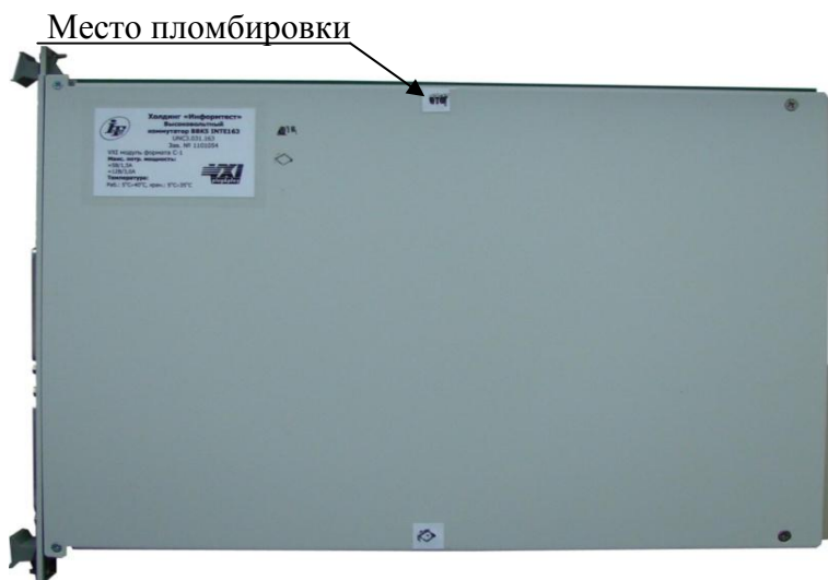
Рисунок 4 – Схема пломбировки функциональных модулей