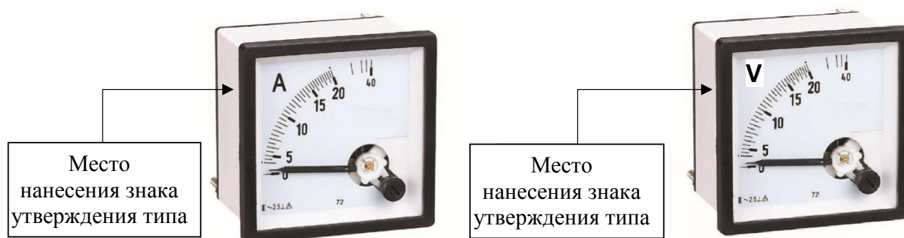
Рисунок 1 - Общий вид амперметров и вольтметров с указанием мест нанесения знака утверждения типа

Пломбирование амперметров и вольтметров не предусмотрено.