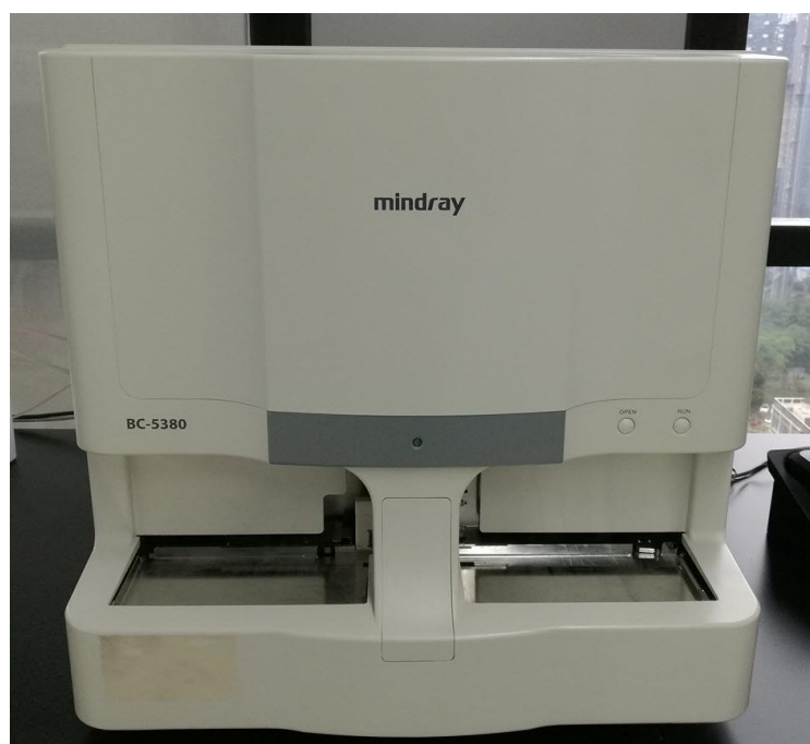
Рисунок 1 в – Общий вид анализаторов гематологических автоматических моделей BC-5380