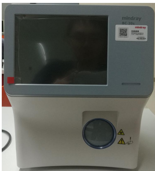
Рисунок 1 а – Общий вид анализаторов гематологических автоматических моделей BC-20s