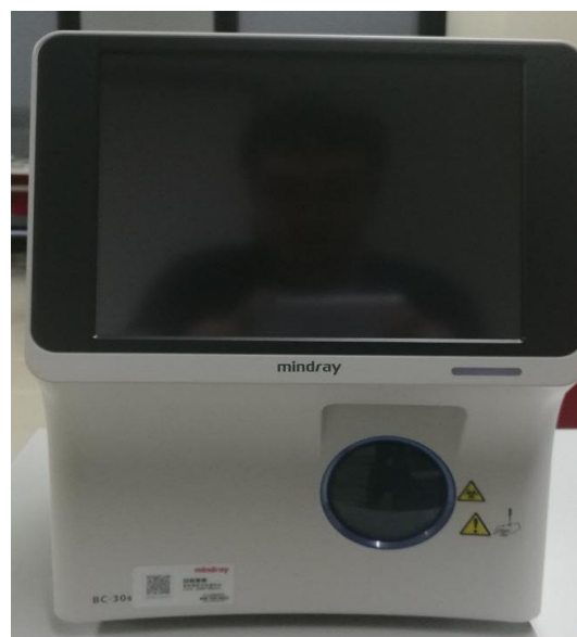
Рисунок 1 б – Общий вид анализаторов гематологических автоматических моделей BC-30s