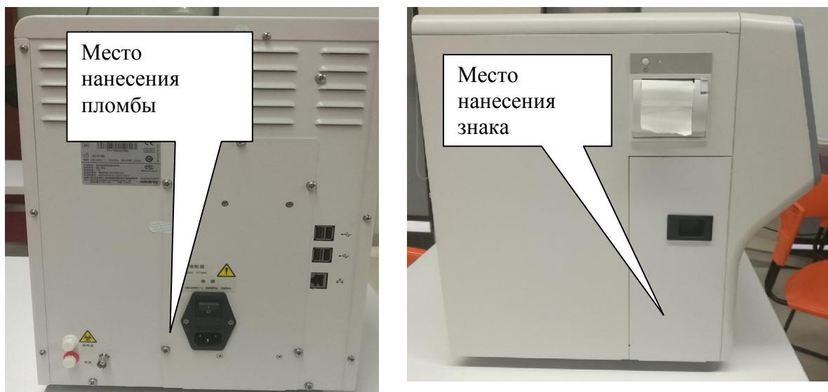
Рисунок 2 а – Схема пломбировки от несанкционированного доступа, обозначение места нанесения знака поверки анализаторов гематологических автоматических моделей ВС-20s, ВС-30s