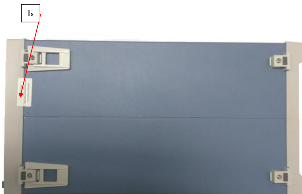
Рисунок 2 – Схема пломбирования источников (Б)