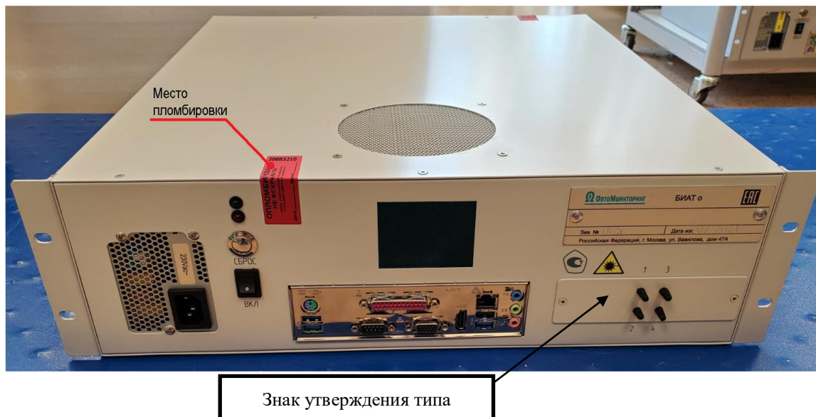
Рисунок 1 – Общий вид блока опроса БИАТ о (лицевая сторона)

Знак поверки наносится на свидетельство о поверке и (или) в паспорт измерителей, в соответствии с действующим законодательством. Измерители имеют серийные номера, обеспечивающие идентификацию каждого экземпляра, номер наносится на маркировочную табличку ударным способом в виде цифрового обозначения (рисунок 4).