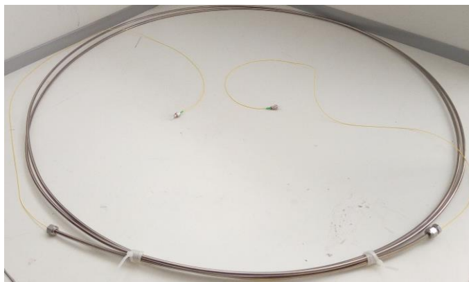
Рисунок 3 – Общий вид волоконно-оптического кабеля системы