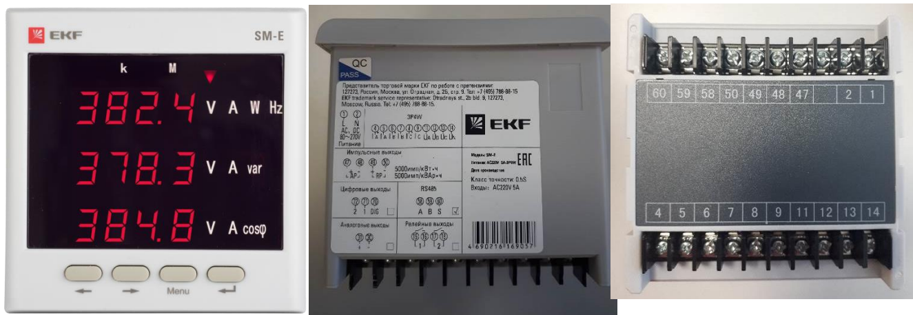
а) модификация SM-E