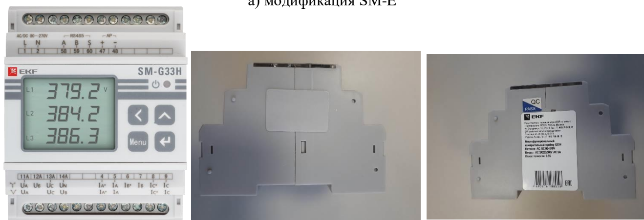
б) модификация SM-G33H