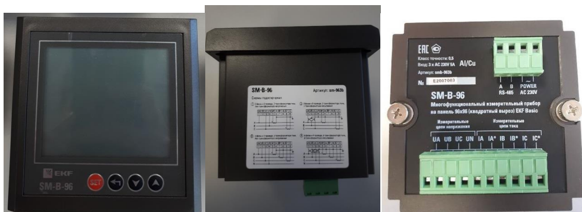
г) модификация SM-B-96