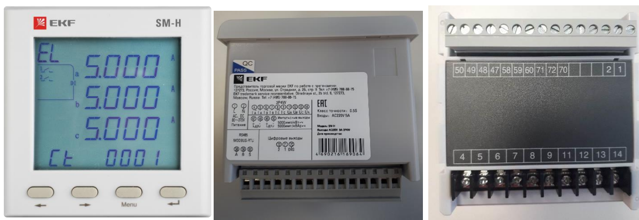
в) модификация SM-H