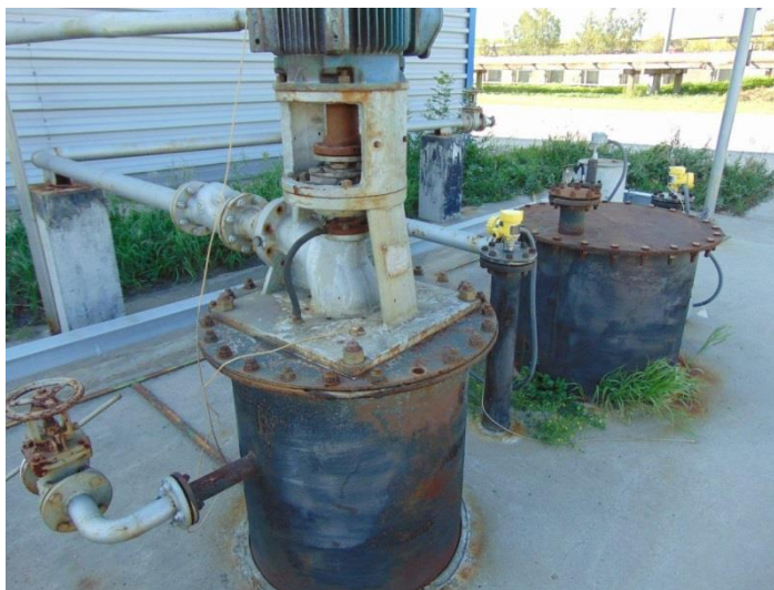
Рисунок 2 – Горловины и замерные люки резервуара стального горизонтального цилиндрического РГС-12,5

Горловины и замерные люки резервуара стального горизонтального цилиндрического РГС-12,5 представлены на рисунке 2.