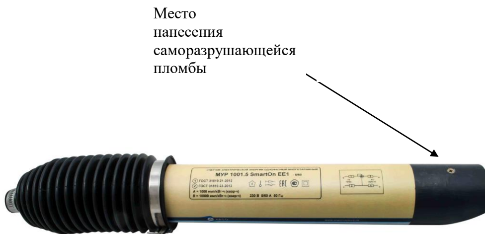
Рисунок 3 - внешний вид счетчика исполнения Split1 с местами на несения саморазрушающейся пломбы