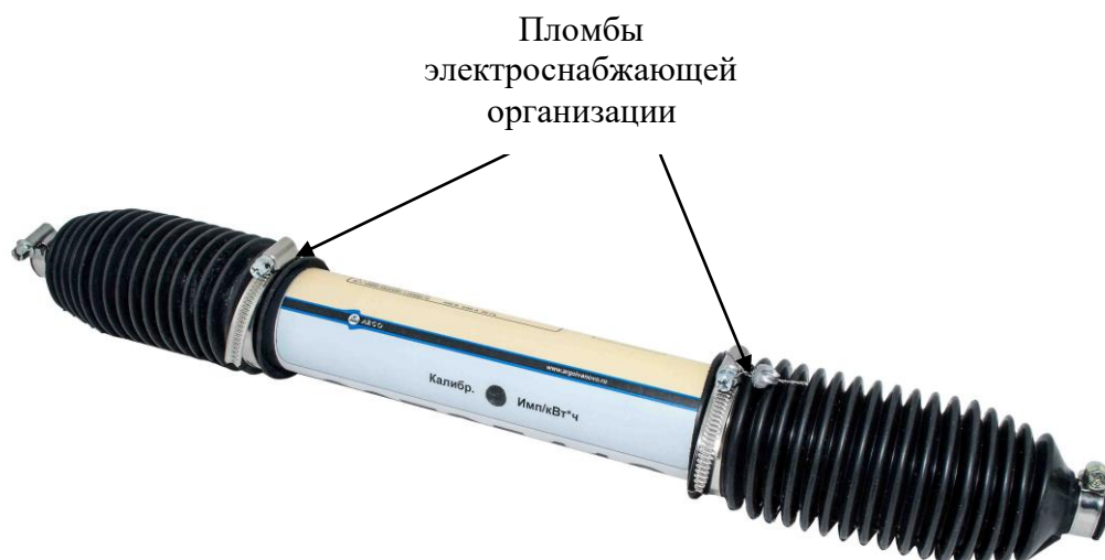
Рисунок 4 - внешний вид счетчика исполнения Split1 исполнения с местами нанесения пломб электроснабжающей организации