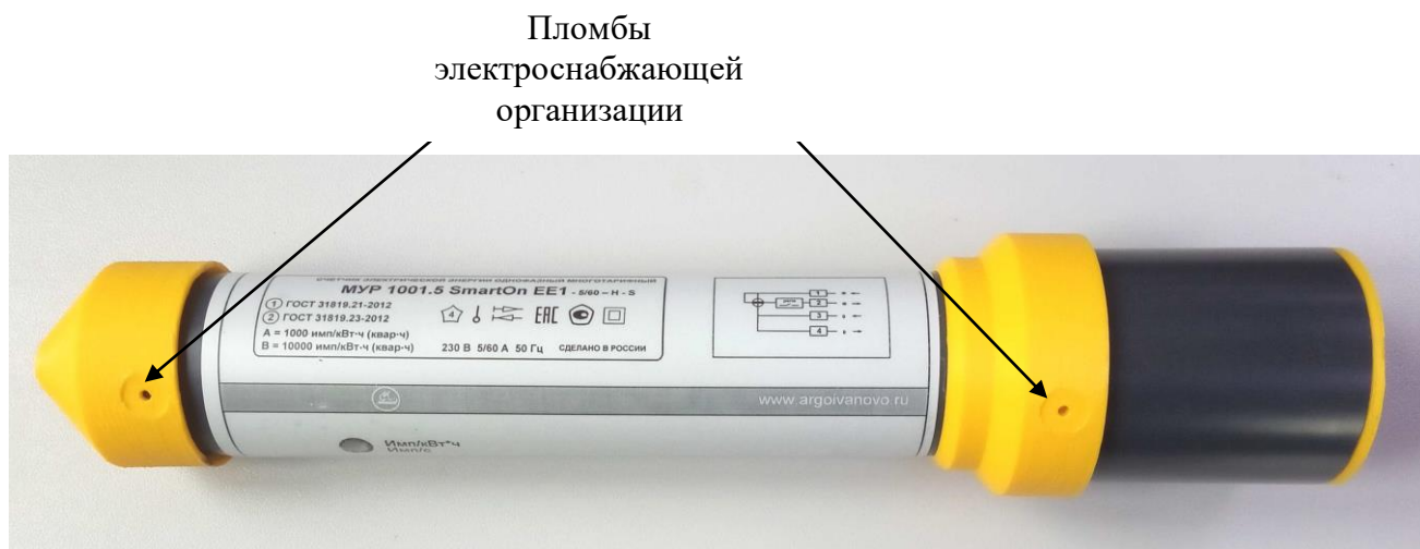
Рисунок 5 - внешний вид счетчика исполнения Split2 исполнения с местами нанесения пломб электроснабжающей организации