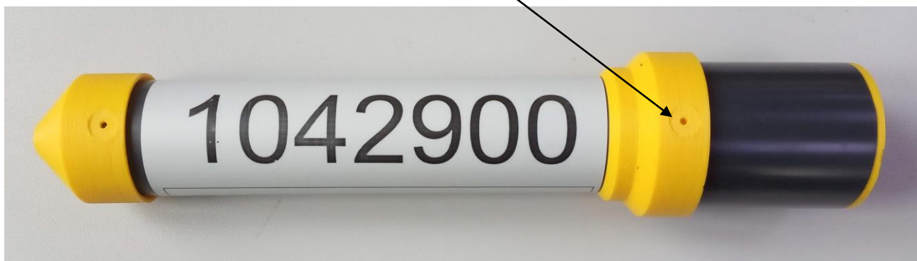
Рисунок 6 - внешний вид счетчика исполнения Split2 с местом нанесения саморазрушающейся пломбы

Место нанесения саморазрушающейся пломбы