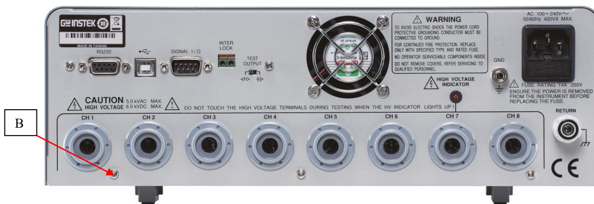
Рисунок 2 – Вид задней панели установок модификаций GPT-79503, GPT-79513, место пломбировки от несанкционированного доступа (В)