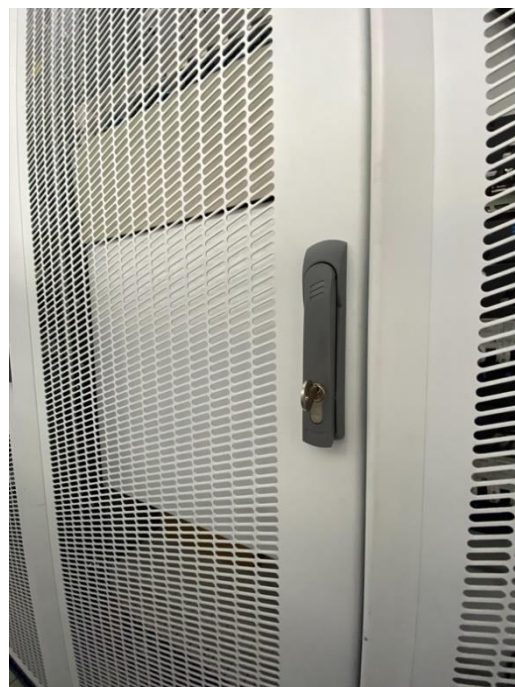
Рисунок 3 - Место блокировки от несанкционированного доступа к стативам с оборудованием

Индексирование серийного номера осуществляется на экране ПЭВМ управления СИПД при участии технического персонала, обслуживающего СИПД, в соответствии с эксплуатационной документацией на оборудование с измерительными функциями.