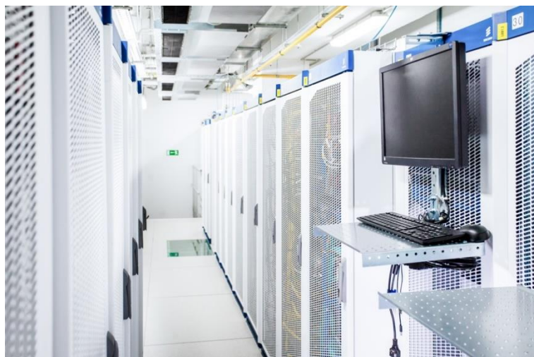
Рисунок 1 - Внешний вид автозала с установленными стативами оборудования