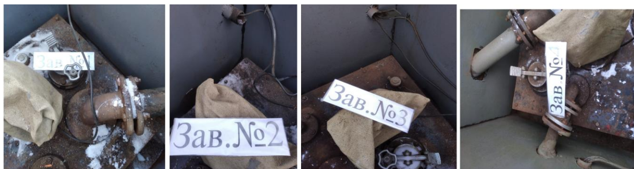
Рисунок 1 – Общий вид резервуаров РГС-30

Нанесение знака поверки на средство измерений не предусмотрено.