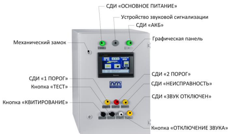
Рисунок 1 – Общий вид одного из исполнений ШКУЗ-ПГП в составе СКЗ

Конструктивно комплексы ШКУЗ-ПГП выполнены в виде навесного (напольного) металлического шкафа с установленными внутри на DIN-рейках составными частями (модулями) и элементами индикации и управления на передней панели.