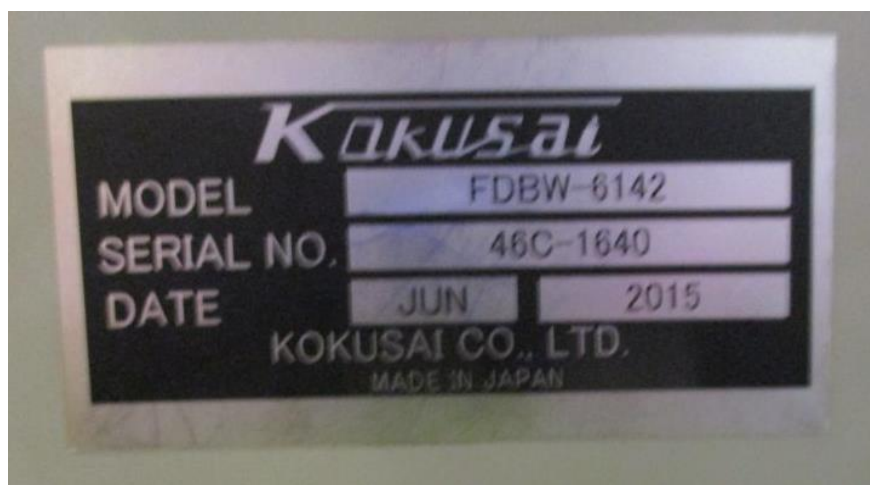
Рисунок 2 – Маркировочная табличка устройства

Для ограничения несанкционированного доступа к узлам устройства наносятся наклейки на корпуса преобразователей. Схема пломбирования представлена на рисунке 3.