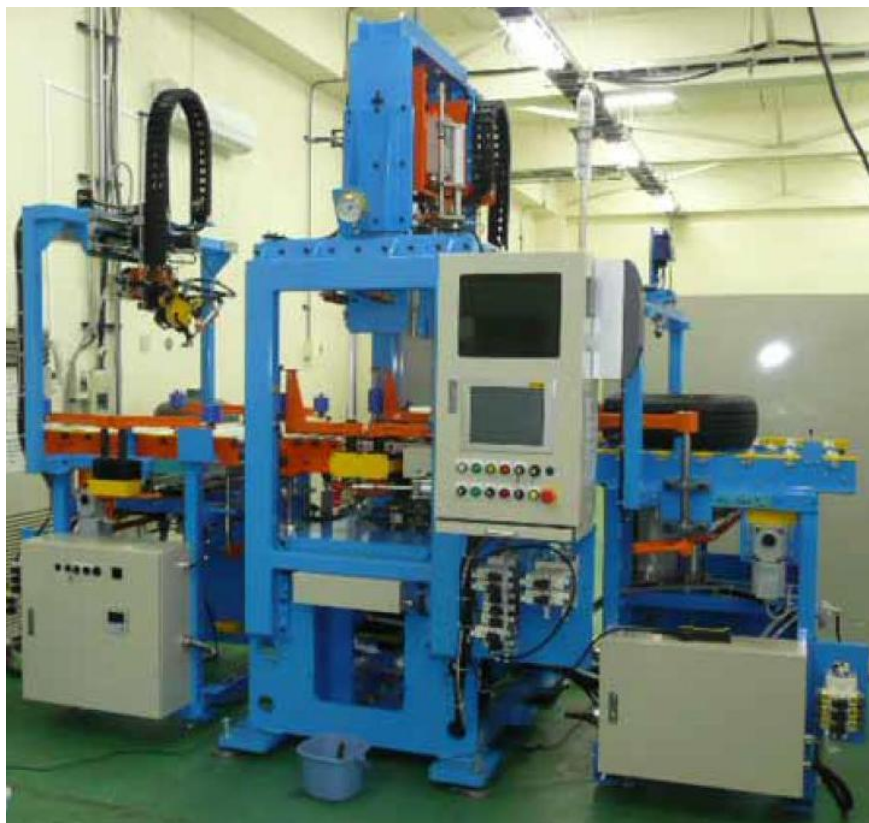
Рисунок 1 – Общий вид устройства балансировочного FDBW-6142