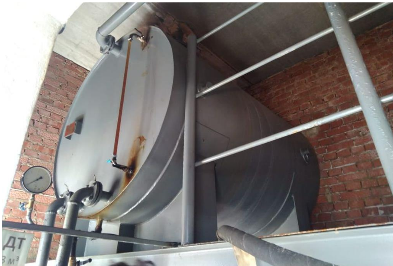
Рисунок 2 – Общий вид резервуара Р-3

Пломбирование резервуара Р-3 не предусмотрено.