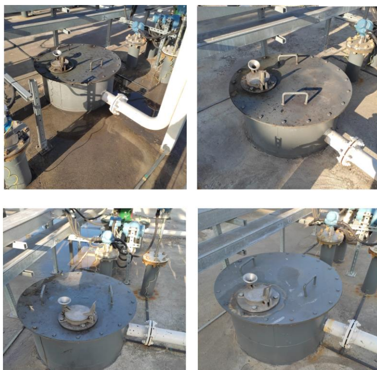
Рисунок 2 – Общий вид резервуаров ЕП-25