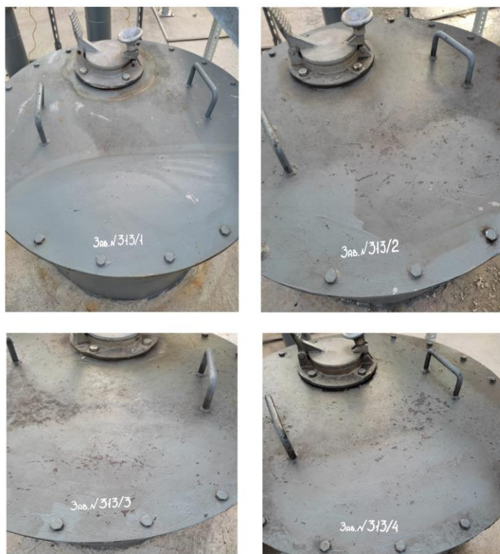
Рисунок 1 – Место нанесения заводских номеров