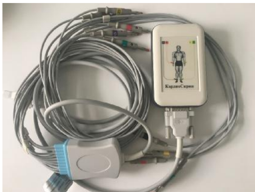
Рисунок 1 – Общий вид системы для скрининговой экспресс-оценки состояния сердца «КардиоСкрин»

Схема пломбировки от несанкционированного доступа, обозначение места нанесения знака поверки представлены на рисунке 2.