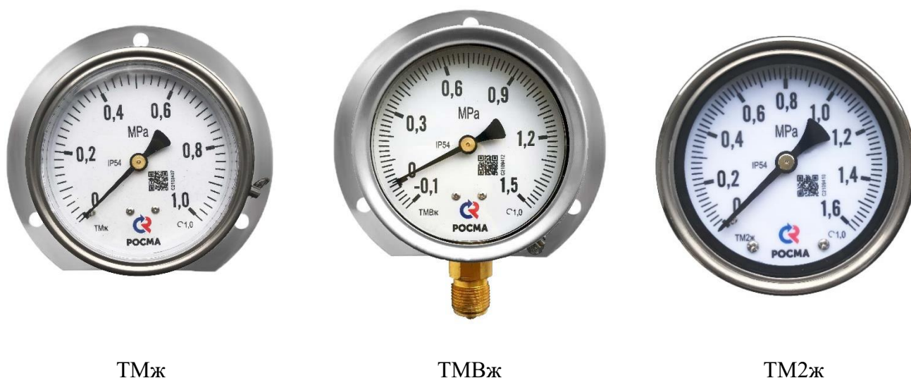
Рисунок 1 – Общий вид манометров

Заводские номера в виде цифрового и (или) цифро-буквенного обозначения, состоящего из арабских цифр и (или) букв латинского алфавита, а также QR-кода, наносятся типографским способом на циферблат манометра.