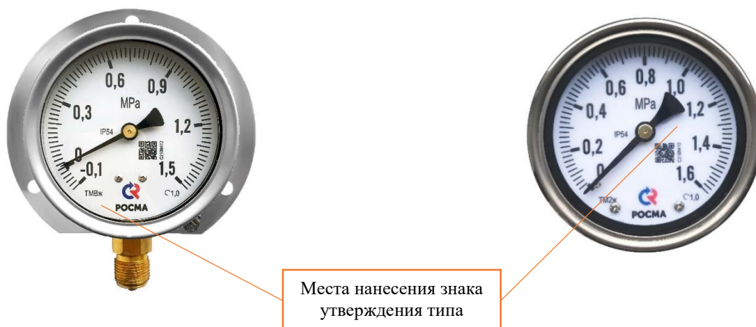
Рисунок 4 – Схема обозначения мест нанесения знака утверждения типа на манометр

Знак утверждения типа наносится на циферблат манометра. Схема нанесения знака утверждения типа на манометр представлена на рисунке 4.