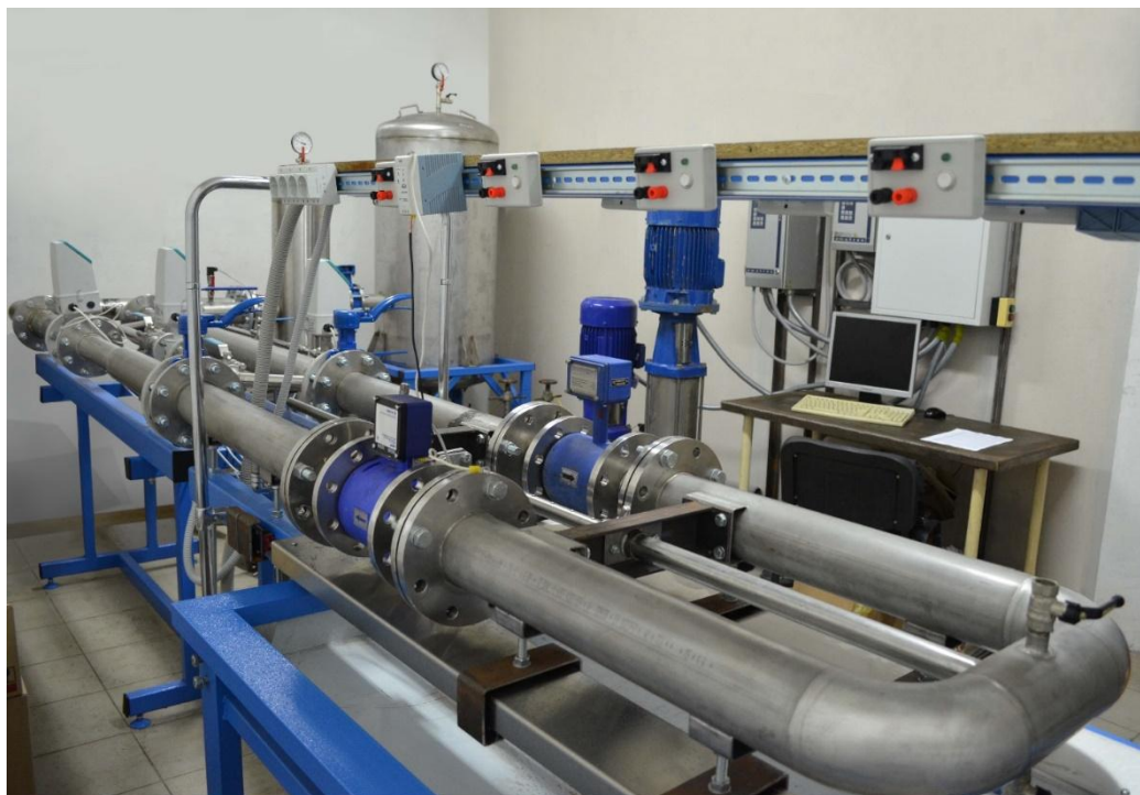
Рисунок 1 – Общий вид установки поверочной FLOWTEST-7