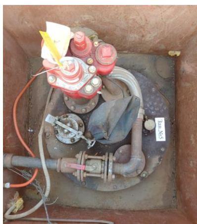
Рисунок 1 – Общий вид резервуара РГС-25

Нанесение знака поверки на средство измерений не предусмотрено.