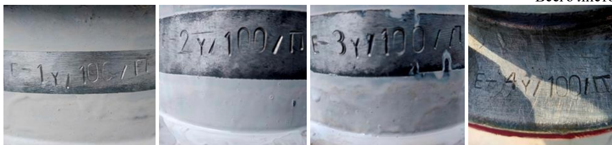
Рисунок 4 – Фотографии заводских номеров резервуаров РГС-100 зав. №№ Е-1у/100/П, Е-2у/100/П, Е-3у/100/П, Е-4у/100/П

Пломбирование резервуаров горизонтальных стальных цилиндрических РГС-100 не предусмотрено.