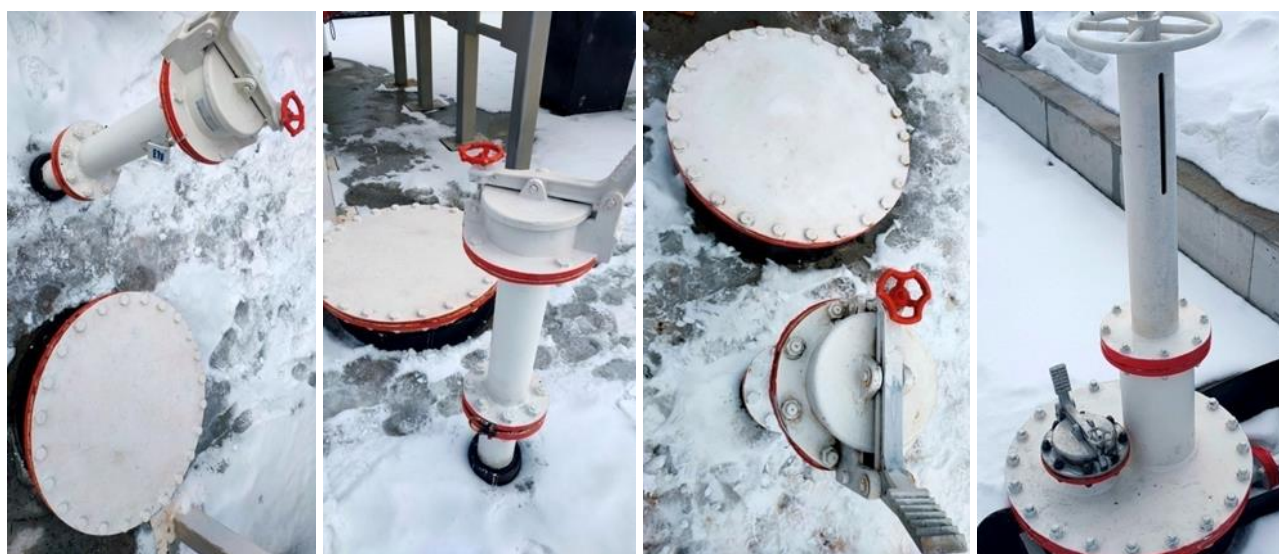
Рисунок 3 – Фотографии горловин резервуаров РГС-100 зав. №№ Е-1у/100/П, Е-2у/100/П, Е-3у/100/П, Е-4у/100/П

Резервуары оснащены необходимыми техническими устройствами для проведения операций по приему, хранению и отпуску нефти и нефтепродуктов: прямо-раздаточными патрубками с запорной арматурой и технологическими люками; дыхательными клапанами, устройствами для замера уровня; средствами пожаротушения; молниезащитой и защитой от статического электричества.