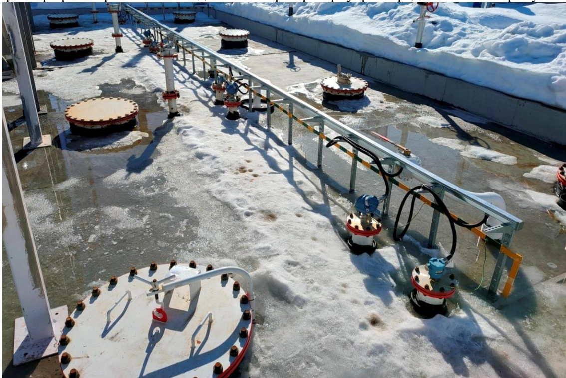
Рисунок 1 – Общий вид площадки размещения резервуаров горизонтальных стальных цилиндрических РГС-100

Общий вид площадки размещения, эскиз конструкции подземных резервуаров, фотографии горловин и заводских номеров резервуаров представлены на рисунках 1-4.