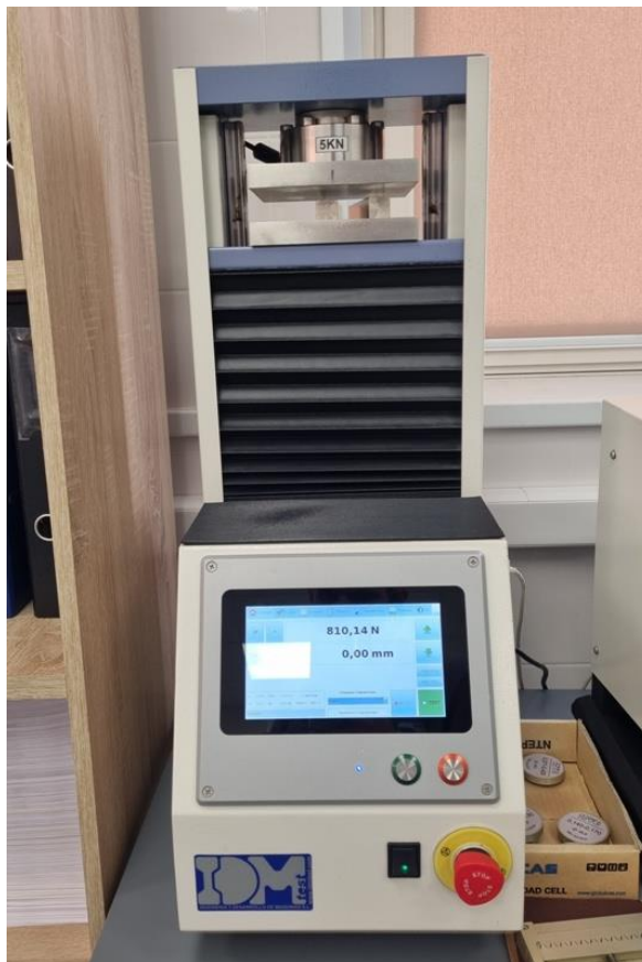
Рисунок 1 – Общий вид пресса испытательного SC-500