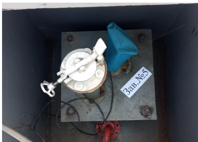
Рисунок 1 – Общий вид резервуара РГС-15

Нанесение знака поверки на средство измерений не предусмотрено.