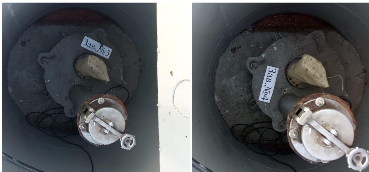
Рисунок 2 – Общий вид резервуаров РГС-60