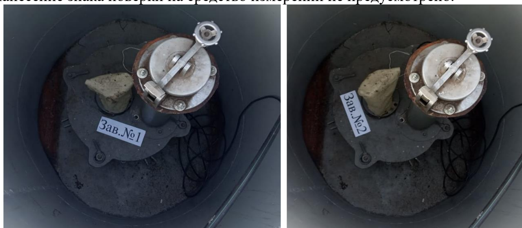
Рисунок 1 – Общий вид резервуаров РГС-60

Нанесение знака поверки на средство измерений не предусмотрено.