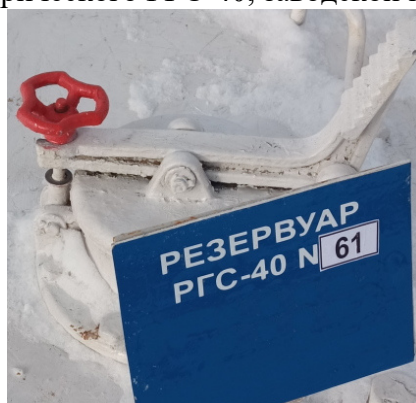
Рисунок 3 – Фотография горловины и заводского номера резервуара стального горизонтального цилиндрического РГС-40, заводской номер 61

Пломбирование резервуаров стальных горизонтальных цилиндрических РГС-40 не предусмотрено.