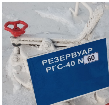
Рисунок 2 – Фотография горловины и заводского номера резервуара стального горизонтального цилиндрического РГС-40, заводской номер 60