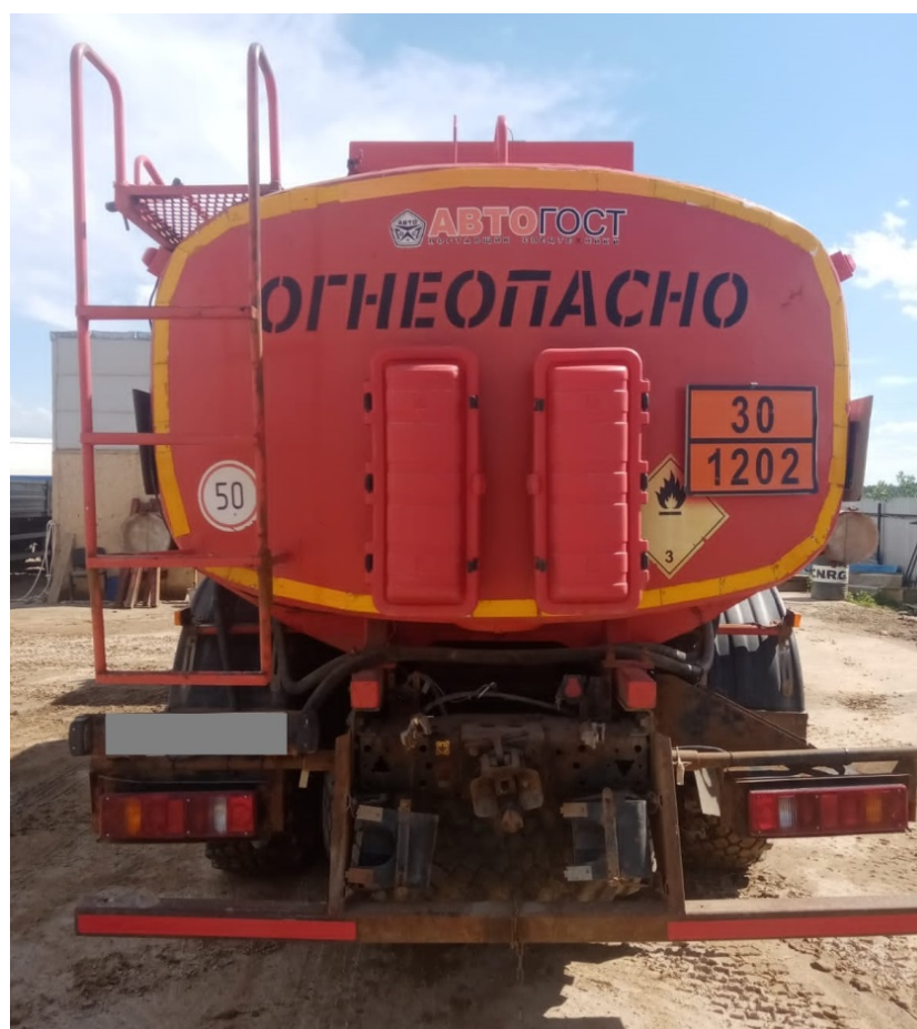
Рисунок 2 – Общий вид автотопливозаправщика 4672G2-10

Схема пломбировки для защиты от несанкционированного изменения положения уровня налива, обозначение места нанесения знака поверки представлены на рисунке 3.