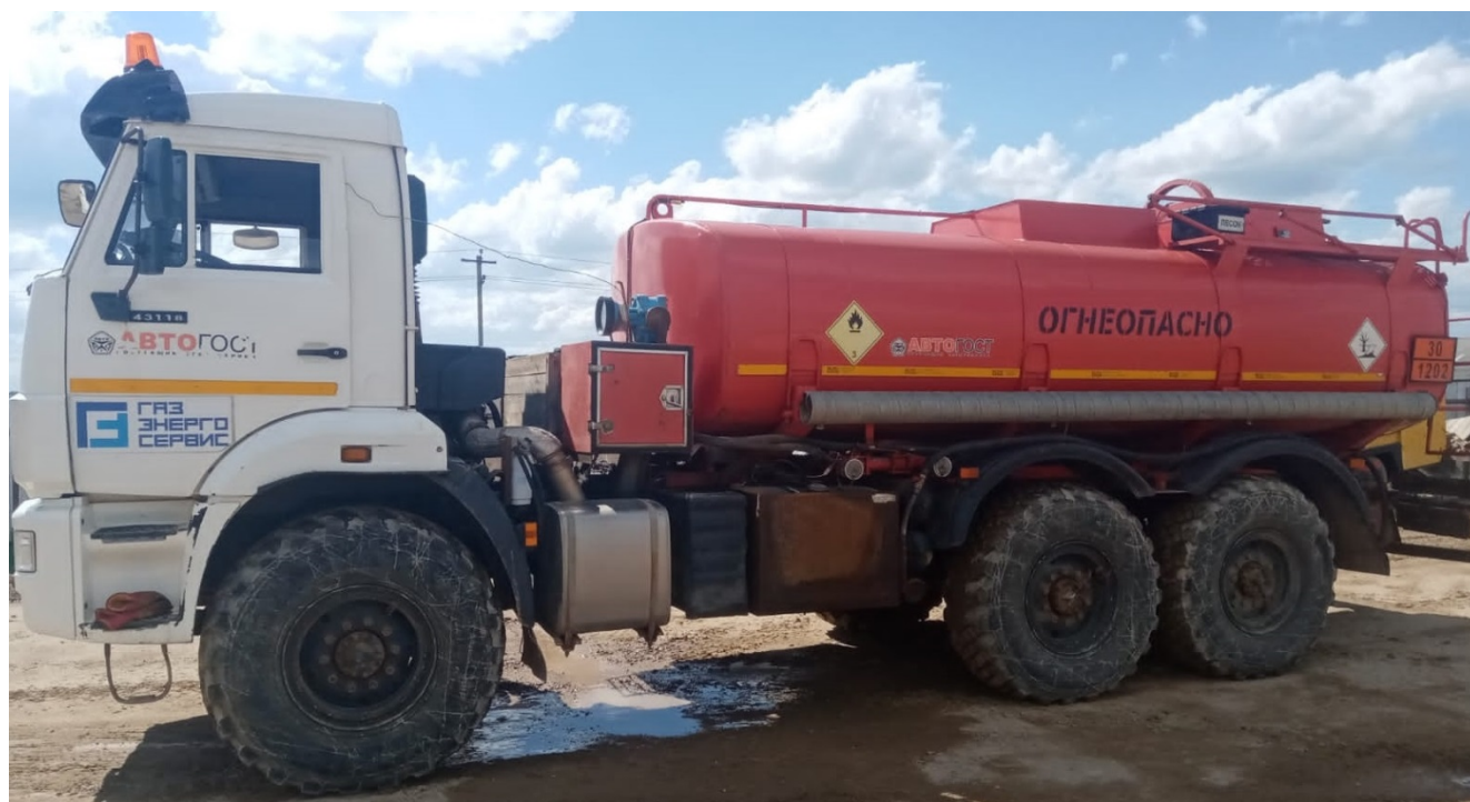
Рисунок 1 – Общий вид автотопливозаправщика 4672G2-10