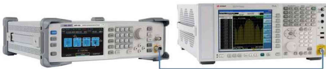
Рисунок 3 – Схема соединения приборов для определения погрешности установки выходного уровня генератора в диапазоне уровней от -50 до -110 дБм и параметров спектра

10.2.19 Последовательно устанавливая уровень выходной мощности генератора в диапазоне от -50 дБм до -110 дБм с шагом 10 дБм, провести измерение уровня P_{уст} , дБм, с помощью анализатора спектра. Зафиксировать результаты всех измерений.