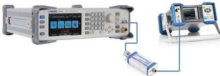
Рисунок 5 – Схема соединения приборов для определения неравномерности АЧХ встроенного НЧ генератора

10.6.1 Подключить преобразователь измерителя мощности к низкочастотному выходу генератора в соответствии с рисунком 5.