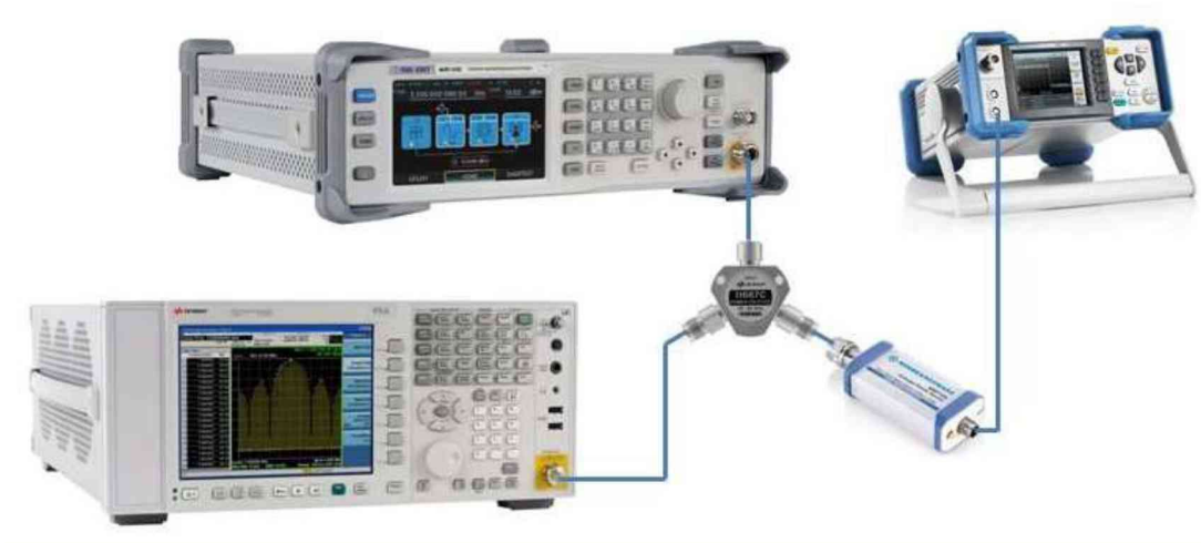
Рисунок 2 – Схема соединения приборов для определения погрешности установки выходного уровня генератора в диапазоне уровней от -50 до -110 дБм

10.2.9 Установить на генераторе параметры по умолчанию. Включить генерацию СВЧ мощности.