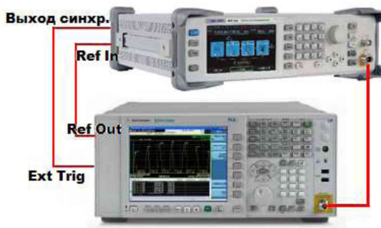
Рисунок 4 – Схема соединения приборов для определения параметров в режиме ИМ

10.4.4 Для определения параметров в режиме ИМ выход генератора подключить на вход анализатора спектра N9030A. Анализатор и генератор синхронизировать по общей опорной частоте, выход синхросигнала с генератора подключить на вход внешней синхронизации анализатора, как показано на рисунке 4.