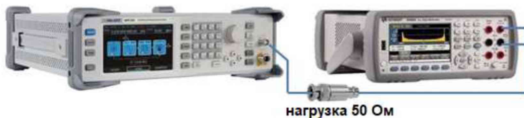
Рисунок 6 – Схема соединения приборов для определения погрешности установки уровня постоянного смещения

10.7.1 Подключить мультиметр к низкочастотному выходу генератора через проходную нагрузку 50 Ом в соответствии с рисунком 6.