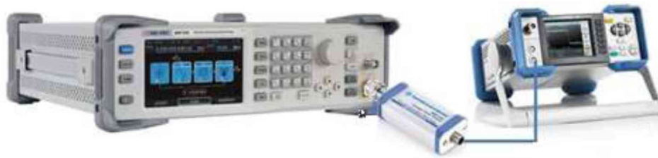
Рисунок 1 – Схема соединения приборов для определения погрешности установки выходного уровня генератора в диапазоне уровней от +20 до -40 дБм

10.2.3 Установить значение фиксированной частоты 1,33 МГц и уровень выходной мощности +20 дБм.