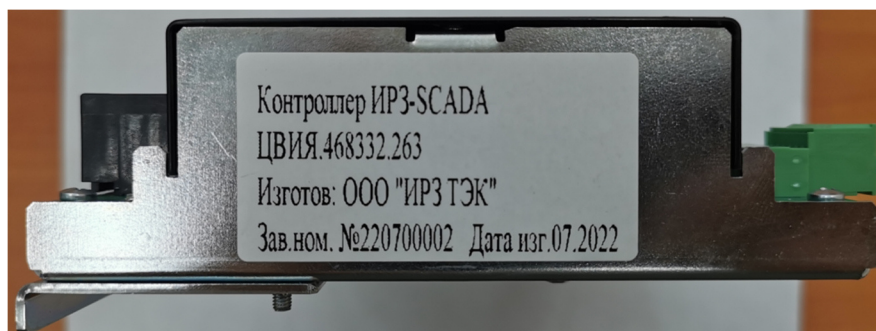
Рисунок 2 – Способ нанесения заводского номера контроллеров

Заводской номер, состоящий из арабских цифр, наносится на наклейку типографическим способом, которая размещается на боковой стороне контроллеров. Способ нанесения заводского номера приведен на рисунке 2. Нанесение знака поверки на контроллеры не предусмотрено.