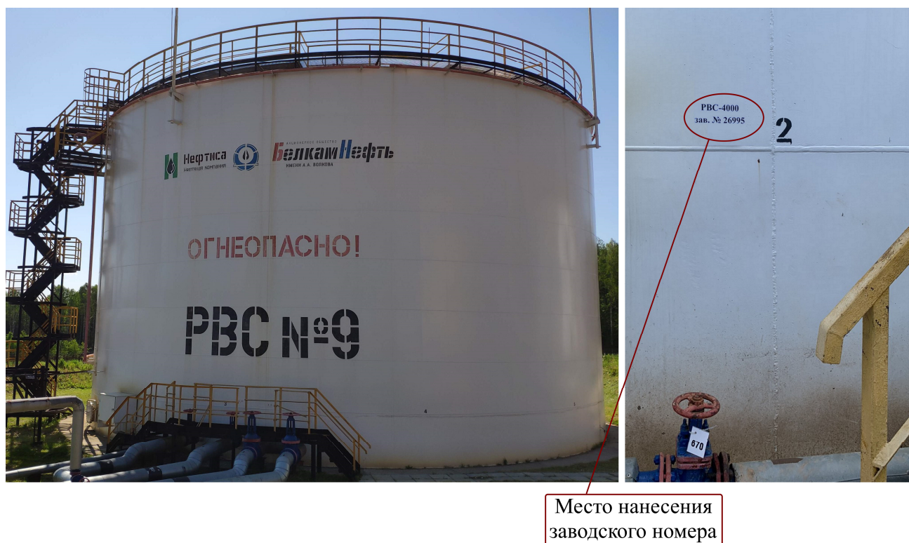
Рисунок 2 – Общий вид резервуара РВС-4000 №26995 с указанием места нанесения заводского номера