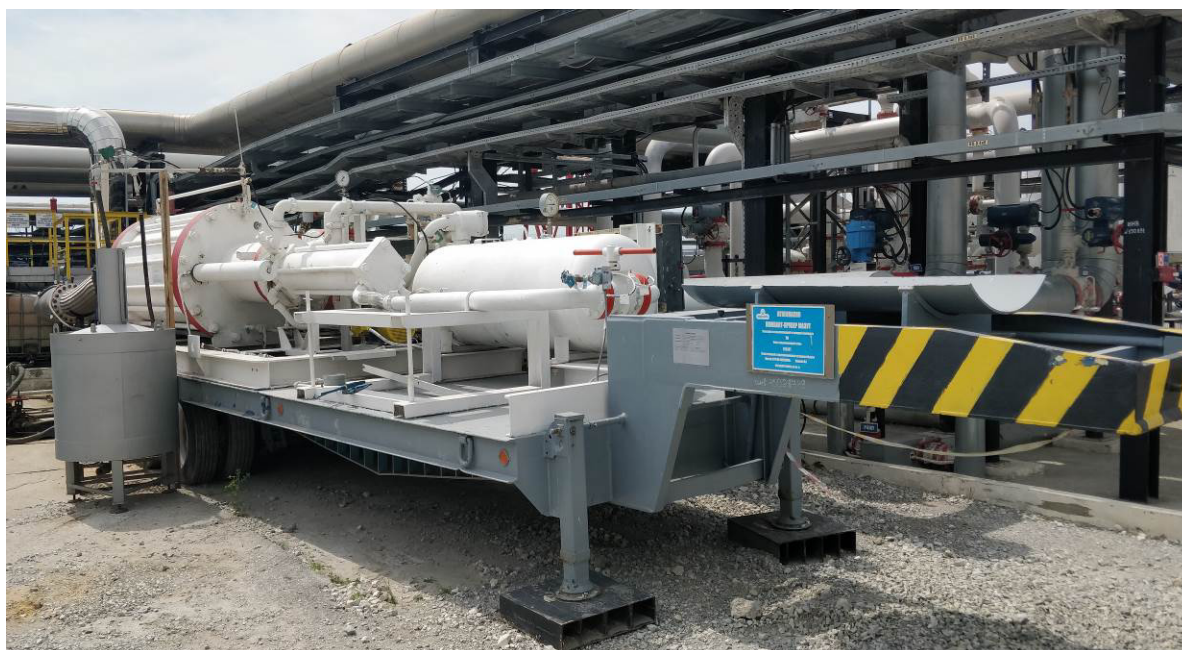
Рисунок 1 – Общий вид установки поверочной

Установку поверочную и средство измерений (поверяемое, калибруемое, контролируемое, градуируемое, испытуемое или исследуемое), в качестве которого могут быть преобразователи расхода жидкости различных принципов действия соединяют последовательно. Через технологическую схему с установкой поверочной и средством измерений устанавливают необходимое значение объемного расхода жидкости. Поршень при открытом тарельчатом клапане приводится в исходное положение в начало измерительного участка компакт-прувера. После этого тарельчатый клапан закрывается и под воздействием потока жидкости поршень начинает перемещаться по измерительному участку. Перемещение поршня по измерительному участку компакт-прувера приводит к последовательному срабатыванию оптических детекторов положения поршня, которые определяют начало и окончание измерения.