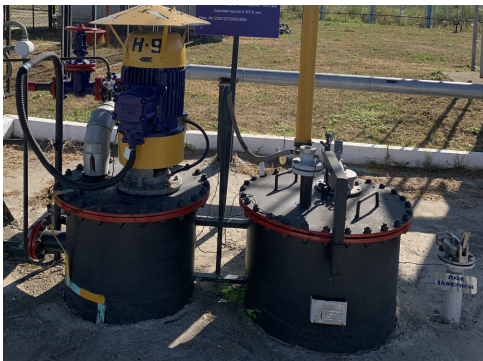
Рисунок 3 – Горловины и измерительный люк резервуара ЕП8-2000-1300-2 зав.№ 4730