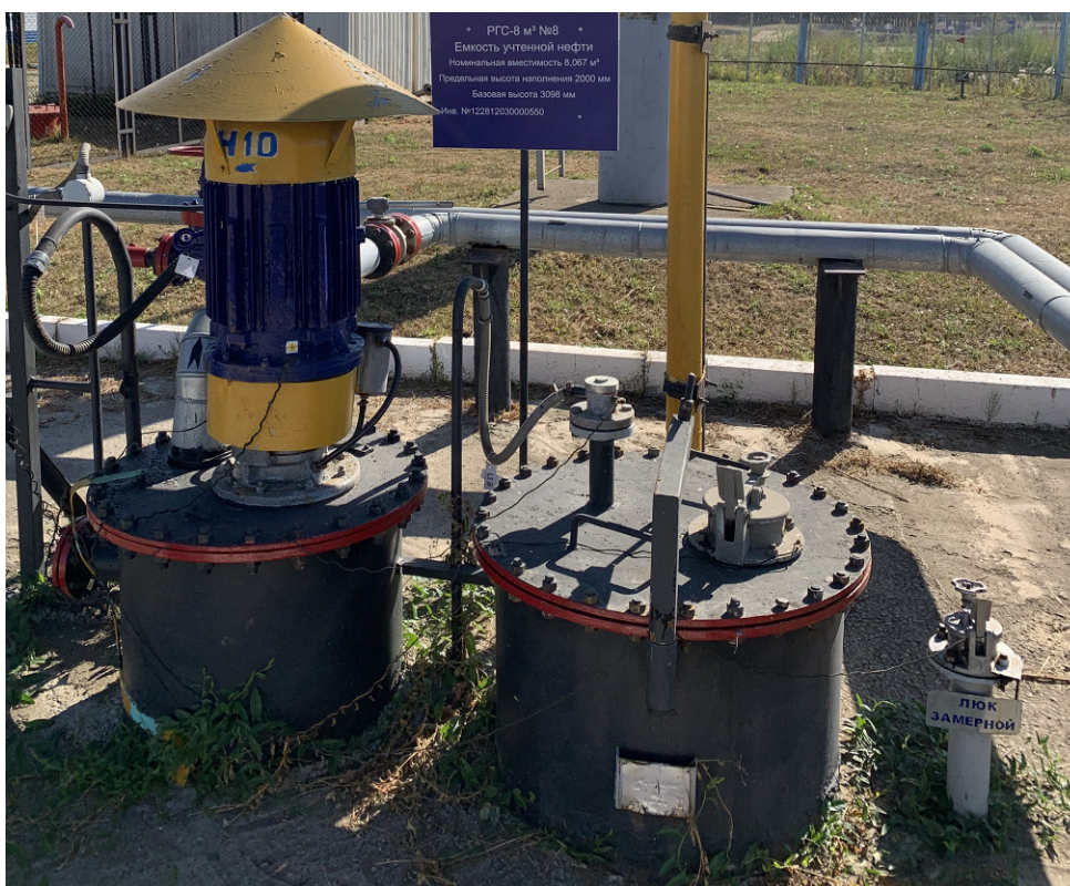
Рисунок 4 – Горловины и измерительный люк резервуара ЕП8-2000-1300-2 зав.№ 4731

Пломбирование резервуаров ЕП8-2000-1300-2 не предусмотрено.