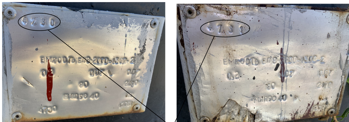
Места нанесения заводских номеров