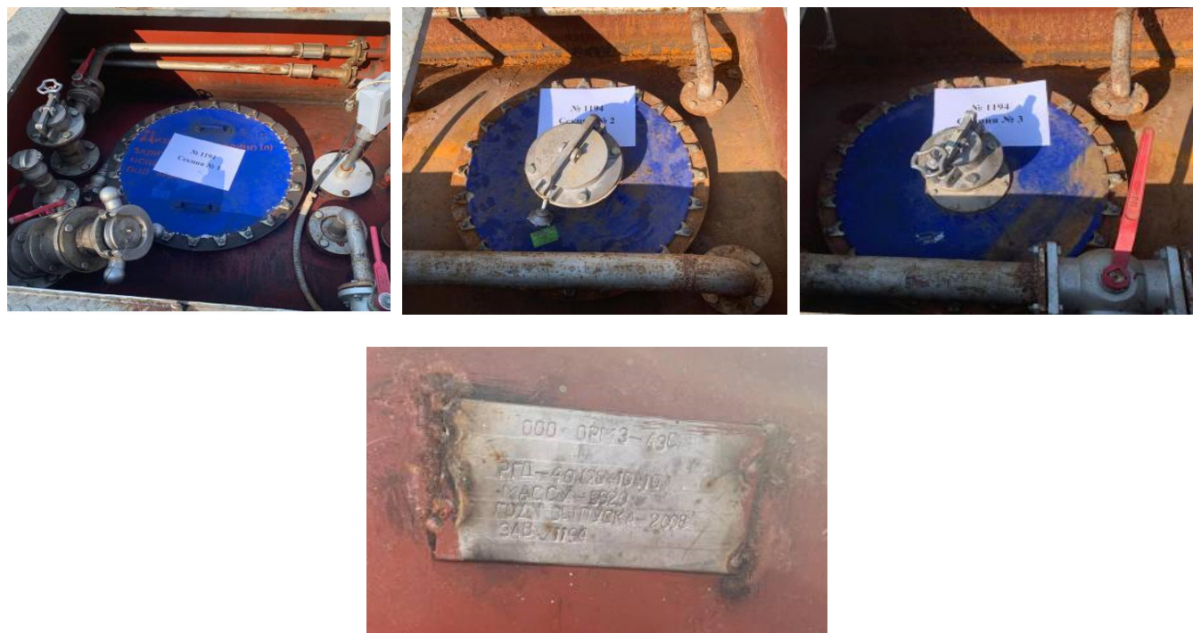
Рисунок 3 – Фото горловин, замерных люков и заводской номер резервуара РГД-40 № 1194