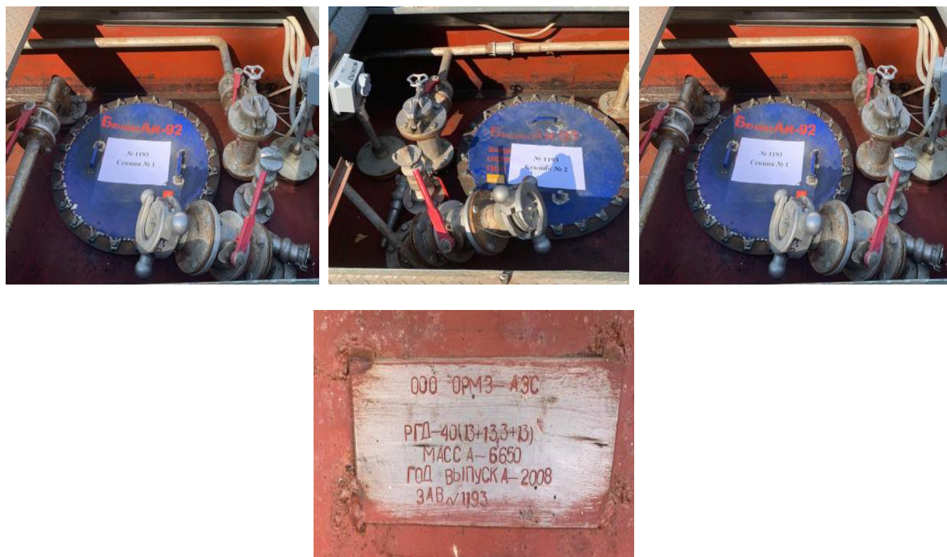
Рисунок 2 – Фото горловин, замерных люков и заводской номер резервуара РГД-40 № 1193