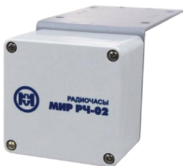
а) модификация РЧ-02.00