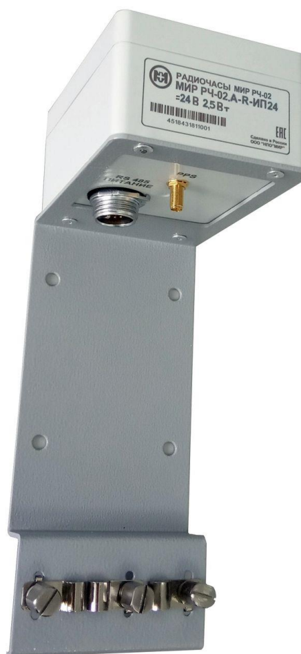
б) модификация РЧ-02.А