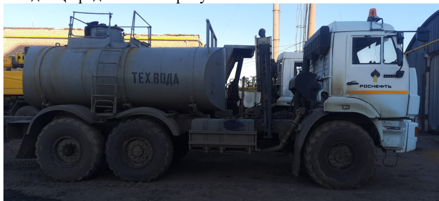
Рисунок 1 – Общий вид АЦ.