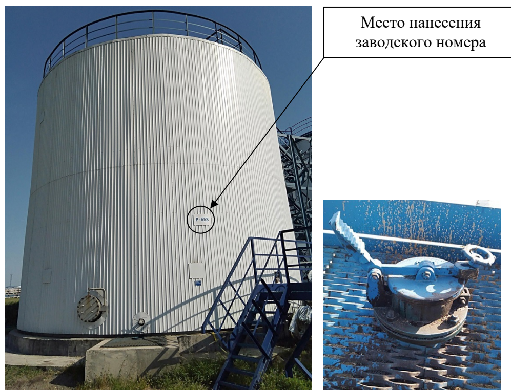
Р и с у н о к 4 – Общий вид резервуара с заводским номером P-558 и его замерного люка