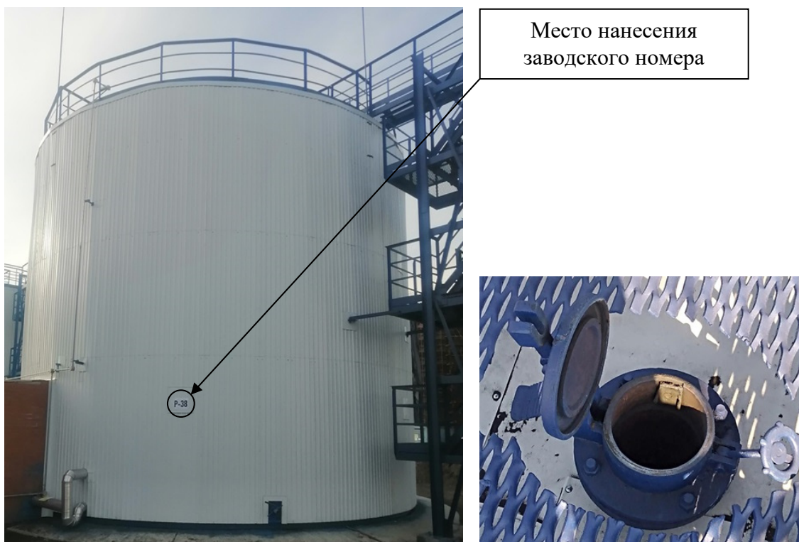
Р и с у н о к 1 – Общий вид резервуара с заводским номером Р-38 и его замерного люка