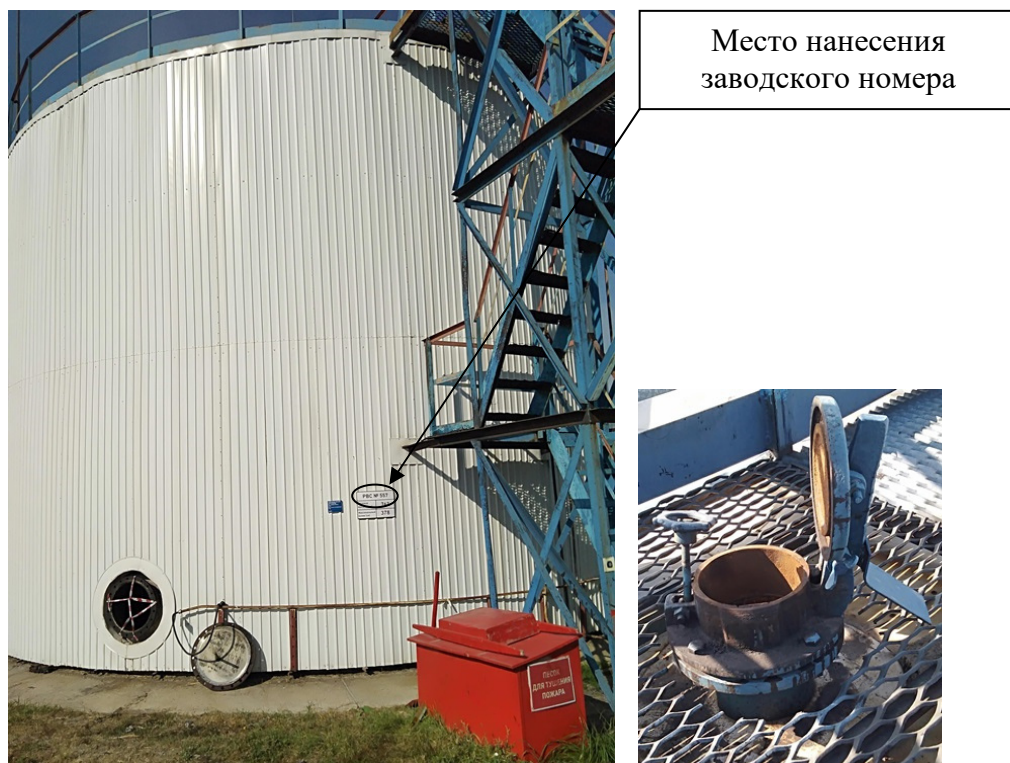
Р и с у н о к 3 – Общий вид резервуара с заводским номером 557 и его замерного люка