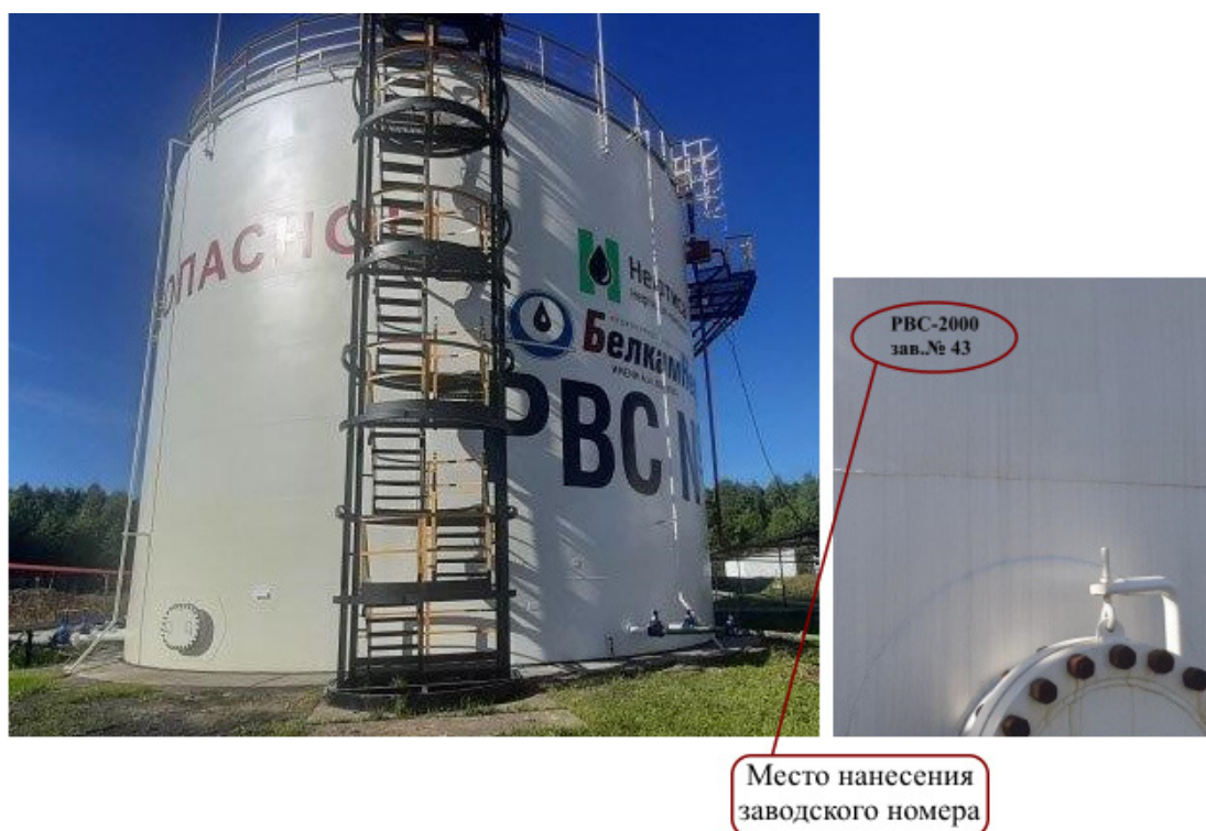
Рисунок 2 – Общий вид резервуара PBC-2000 №43 с указанием места нанесения заводского номера