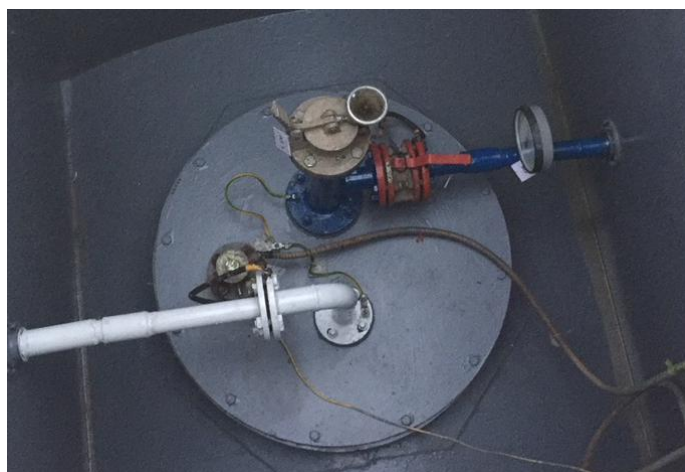
Рисунок 6 - Общий вид видимой части конструкции резервуара РГС-20 № 636