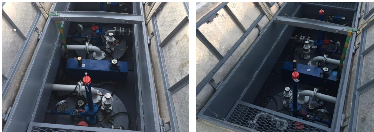
Рисунок 1 - Общий вид видимой части конструкции резервуаров РГСД-25 №№ 604, 605

Общий вид видимой части конструкции и эскизы резервуаров стальных сварных горизонтальных РГС-20, РГСД-25, представлены на рисунках 1-6.