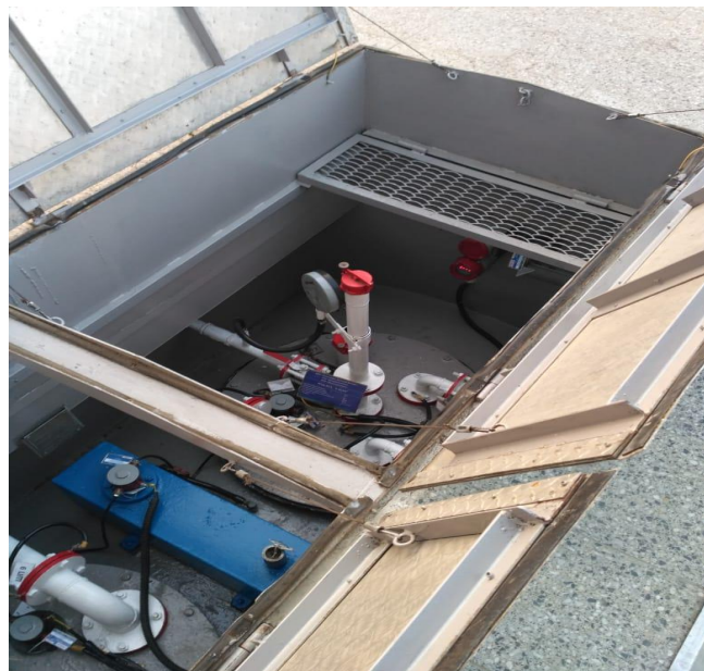
Рисунок 3 - Общий вид видимой части конструкции резервуаров РГСД-25 №№ 610, 611