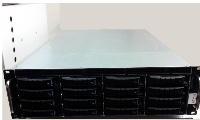
Сервер синхронизации офисного типа ПАК DIR «Интегра-КДД-Р»