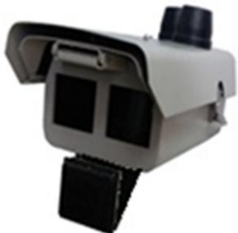
Моноблок с радарным модулем ПАК DVR «Интегра-КДД-СВК-М»-Х