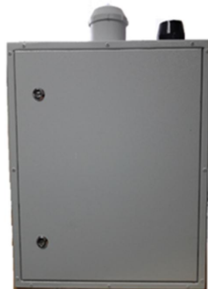
Сервер синхронизации уличного типа ПАК DIR «Интегра-КДД-СВ»