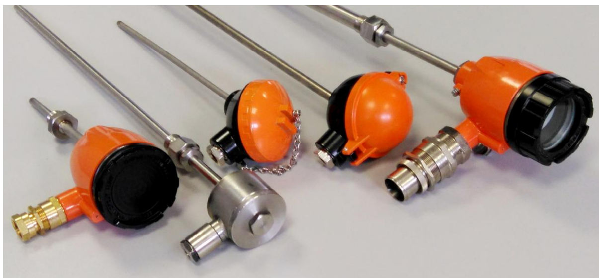
Рисунок 1 - Датчики температуры серий ТП, ТР

Общий вид датчиков температуры серий ТП, ТР представлен на рисунке 1.