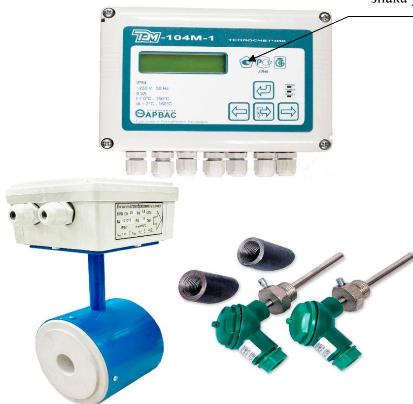
Рисунок 2– Внешний вид теплосчетчика (исполнение ТЭМ-104М-1)

Место для нанесения знака утверждения типа