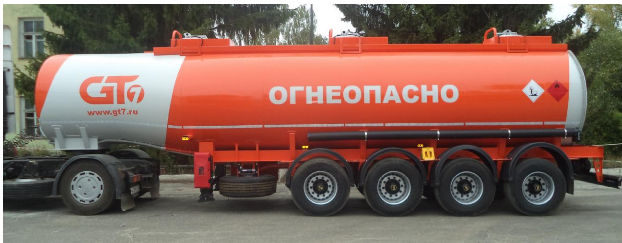
Рисунок 1 - Общий вид полуприцепа-цистерны ППЦ-33

На боковых сторонах и сзади цистерна имеет надпись «ОГНЕОПАСНО», знак ограничения скорости и знаки с информационными табличками для обозначения транспортного средства, перевозящего опасный груз.