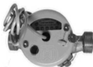
ВСТ (ОВСХд; ОВСГд)