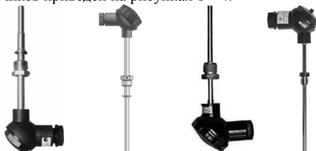
КТПТР-05 (ТПТ-15) КТПТР-01 (ТПТ-1) КТСП-Н (ТСП-Н) ТЭМ-110 (ТЭМ-100)