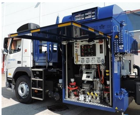
Рисунок 1 – Общий вид системы спереди на средстве заправки

Фотографии общего вида системы и ее составных частей представлены на рисунках 1 – 5.