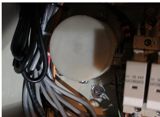
Рисунок 11 – Пломбирование преобразователя температуры PR