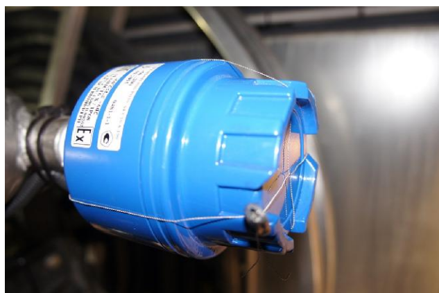
Рисунок 10 – Пломбирование датчика температуры