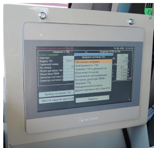
Рисунок 5 – Панель оператора сенсорная (ПОС-10)