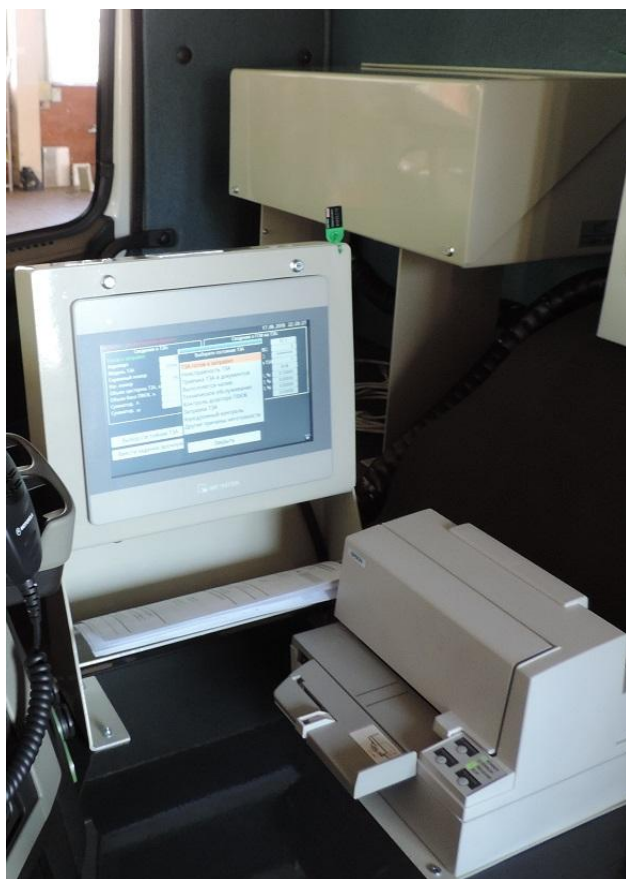
Рисунок 3 – Общий вид составных частей системы (БСК-01 с закрытой защитной крышкой, ТОС-01, принтер) в кабине средства заправки