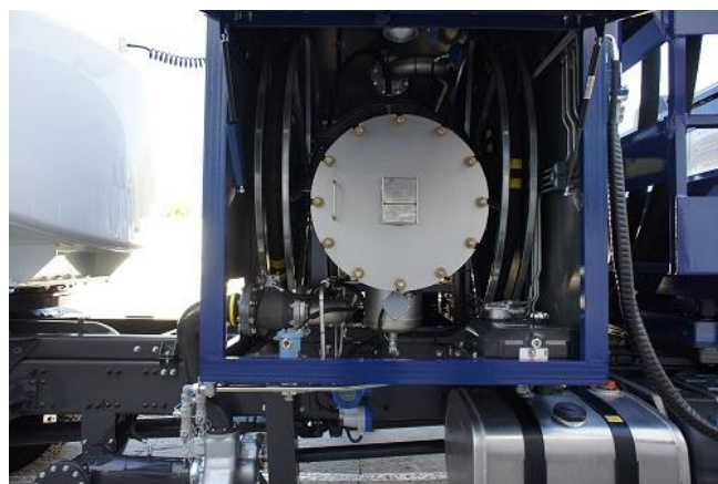
Рисунок 2 – Общий вид системы сзади на средстве заправки