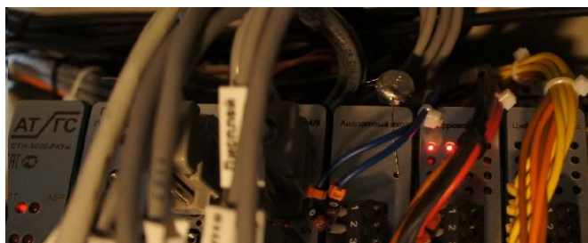
Рисунок 8 – Пломбирование платы аналогового входа контроллера