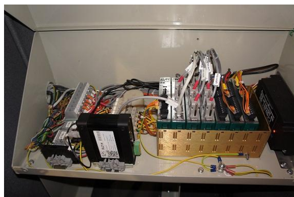
Рисунок 4 – БСК-01 без защитной крышки