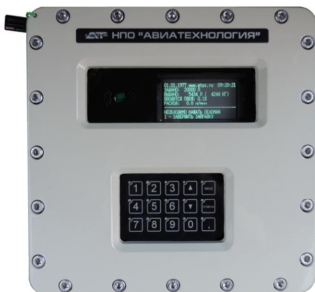
Рисунок 6 – Пульта управления специальным контроллером (ПУСК-01)