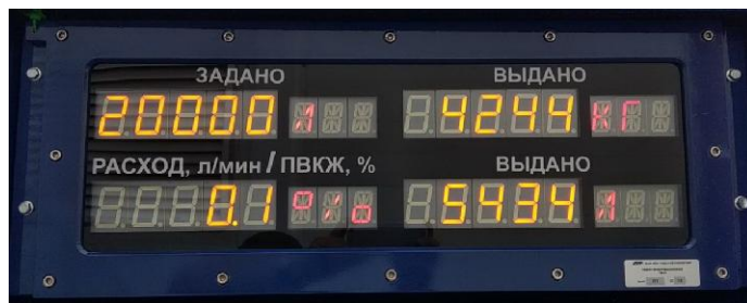
Рисунок 7 – Табло информационное (ТИ-01)