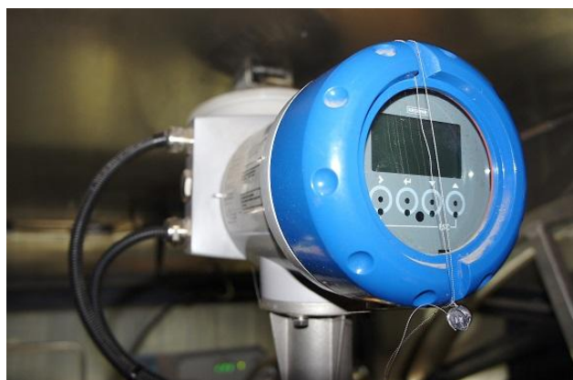
Рисунок 9 – Пломбирование расходомера-счетчика массового