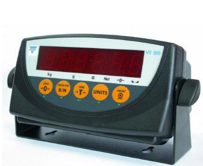
VT 100 - вид спереди