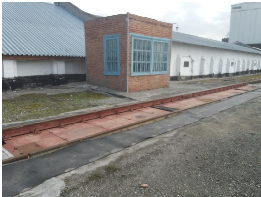
Рисунок 1 – Общий вид весов

Общий вид индикатора VT 100 и схема пломбировки от несанкционированного доступа, обозначение места нанесения знака поверки представлены на рисунке 2.