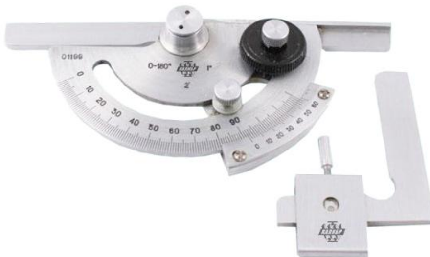
Рисунок 1 – Общий вид угломеров типа 1

Пломбирование угломеров не предусмотрено.