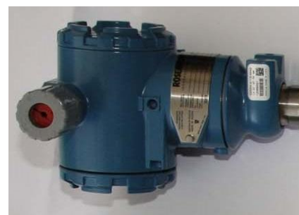
в) преобразователь давления