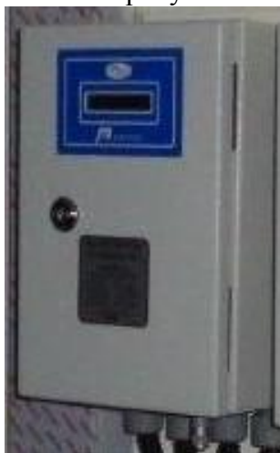
а) вычислитель, установленный в шкафу

Общий вид комплексов представлен на рисунке 1.