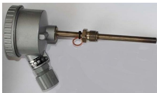
б) преобразователь температуры