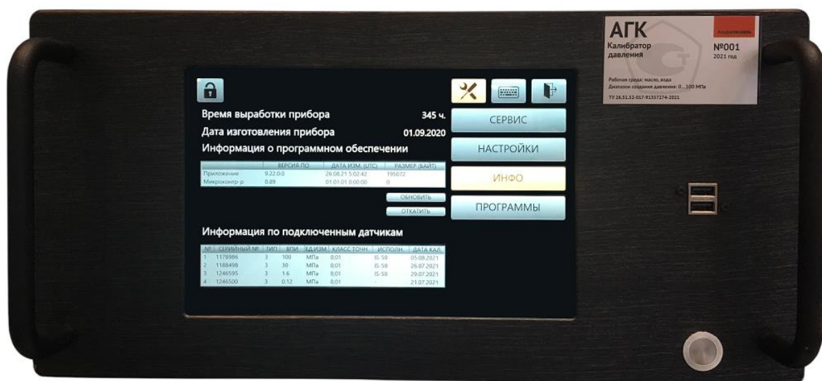
Рисунок 2 – Лицевая панель калибратора