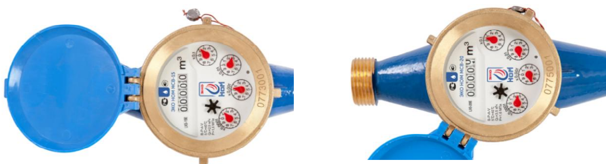
Исполнение ЭКО НОМ МСВ-15

Общий вид счетчиков воды крыльчатых мокроходных многоструйных ЭКО НОМ МСВ представлен на рисунке 1.